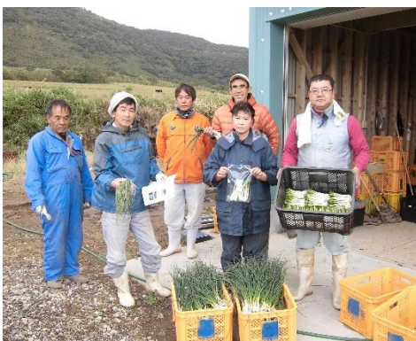
都市主要市場で好評の潮風島らっきょう