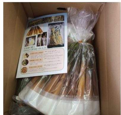
居酒屋チェーンや料理店でも人気の大名筍

トカラ伝統産物のブランド化が着々と進んでいる。島らっきょうは東京築地など全国6市場に継続出荷され、平成26年度は約3t 販売総額400万円と急成長しました。また、東京の全国の特産品が集まるアンテナショップでも沖縄産に比べ、美味しく綺麗と高い評価をいただき、入荷後すぐに完売するほどの人気とのこと。