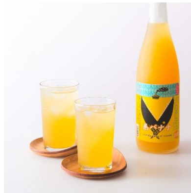
通年販売される島バナナが原料のリキュール